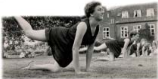
Gymnastik på plænen ved Holmstrupgård.

Det er umiddelbart svært at forestille sig, at jeg sidder blandt psykisk syge unge. Det er ganske få ting, der indikerer, at