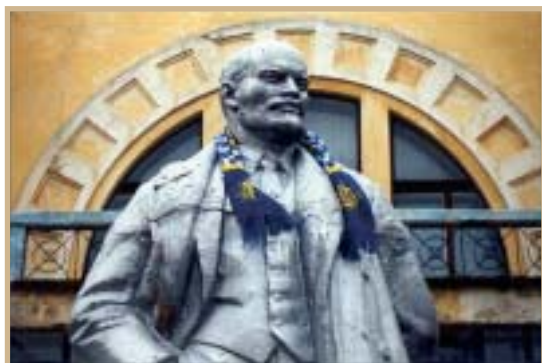
1-0 til virkeligheden.

Min absolut bedste biografoplevelse her i efteråret har været Wolfgang Beckers rørende film "Goodbye Lenin", der udspiller sig i Berlin fra oktober 1989 og nogle måneder frem.