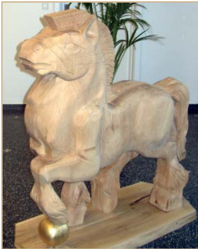
Her vogter jeg – indgangen til kontoret på Ellengården, Århus.