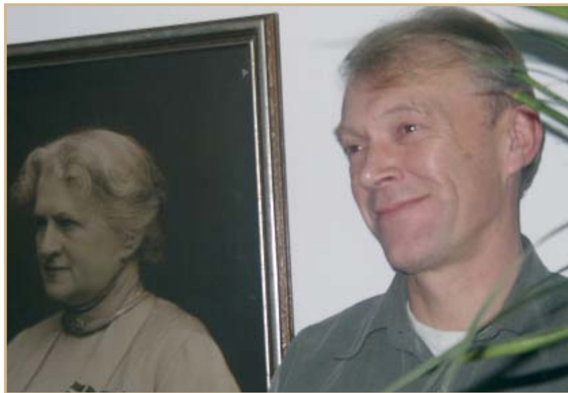
Fruen og chefen.

2003 har også været et år, hvor vi i foreningens bestyrelser flere steder har måttet arbejde med "teamdannelsen" på arbejdspladsen. Arbejdet blandt socialt truede og belastede børn og unge kræver mange psykiske ressourcer hos