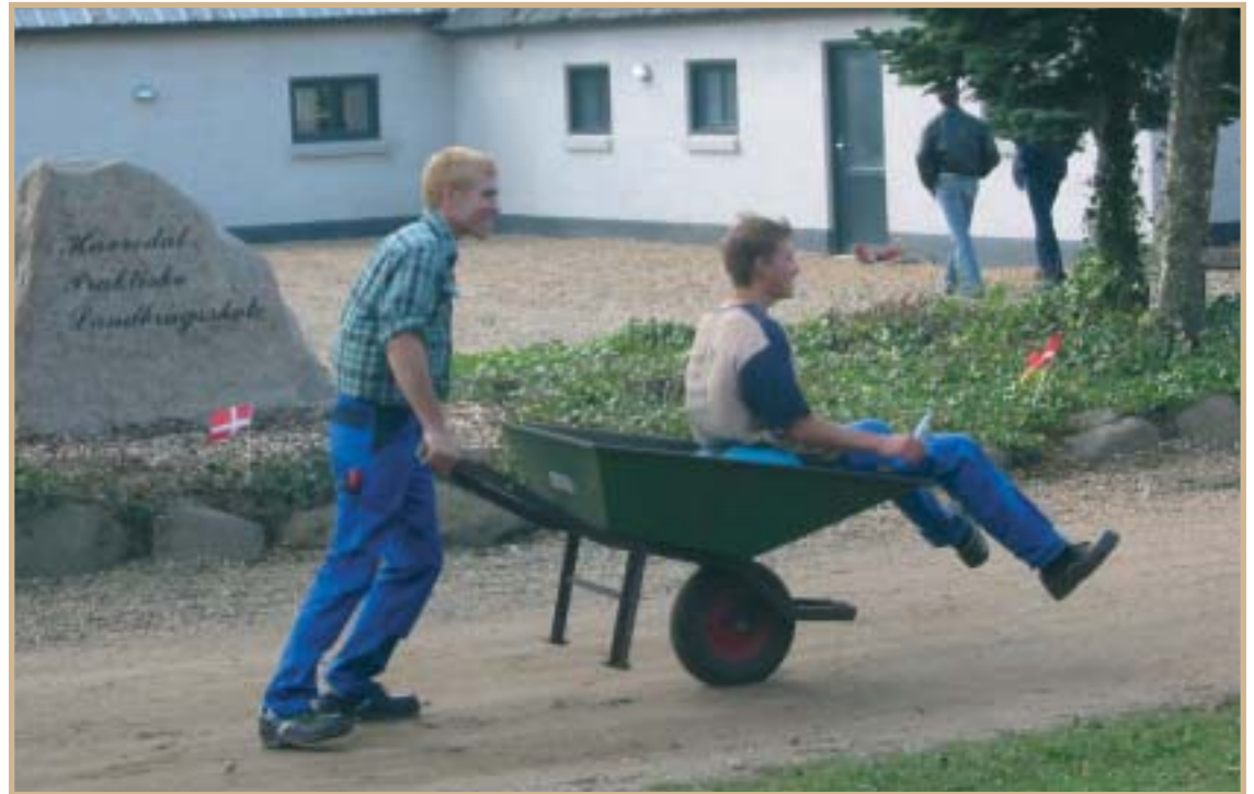
Frem i skoene, Havredal 2003.

Havredal Praktiske Landbrugsskole har udviklet sig meget gennem årene, men de grundidéer og tanker, der dengang var med til at starte skolen, eksisterer stadig i målsætningen. Havredal Praktiske Landbrugsskole kan i dag tilbyde et 3-årigt praktisk orienteret bo-