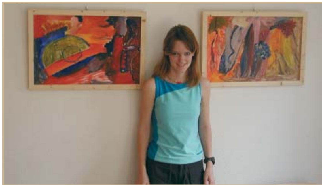
Lokal kunstner udstiller.