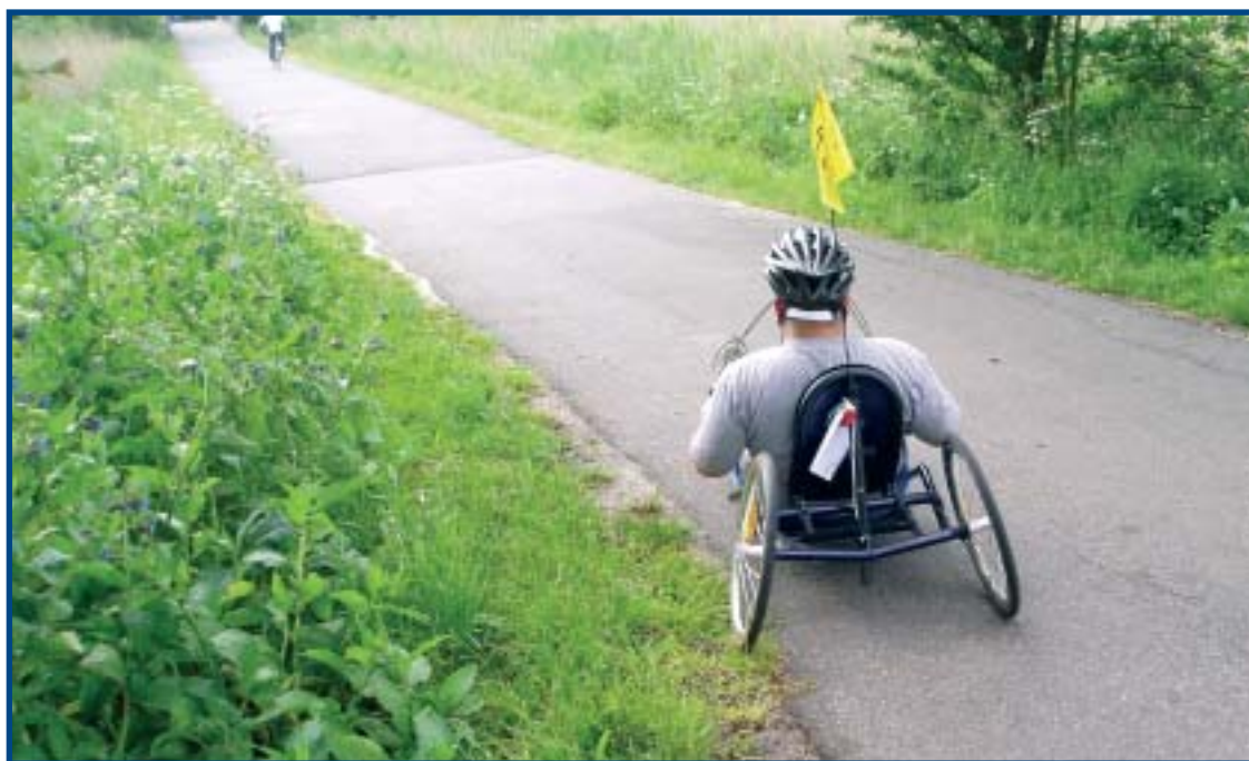
Solbakkens beboere Brabrand Søen rundt.