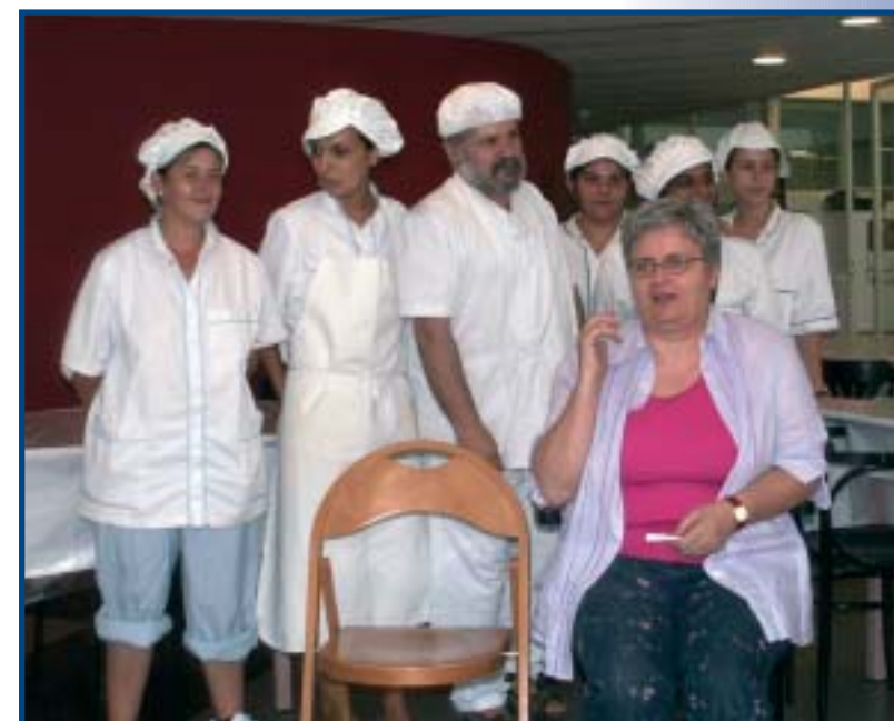
Treball – Resocialiseringscenter for kvinder og mænd.

De indsatte på dette arbejdssted var så dygtige, at alt hvad de fremstillede blev solgt lokalt. Institutionen hjælper dem