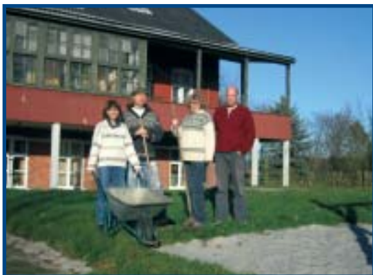
Støttebeboere i haven på Høvej.

ståelse og tillid. Flere af støttebeboerne arbejder alene, og det var meget tydeligt, at de havde stor gavn af at møde andre i samme funktion som dem selv. Støttebeboerne tumler ofte med store og krævende problemstillinger, der sjældent har en fast løsningsmodel, så der var stor lydhørhed og indbyrdes respekt over for hinandens oplevelser og erfaringer. De fandt støtte i hinandens erfaringer og tillid til egne måder at takle situationer på. For os, der ikke havde et større kendskab til støttebeboernes funktioner, var det en stor oplevelse at høre om deres tilværelse med de unge, de bor sammen med. Det sociale ar-