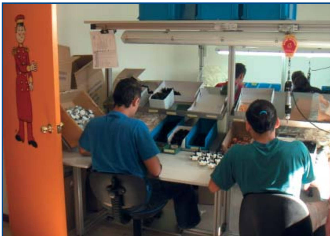
ARED – Resocialiseringscenter for kvindelige afsonere.

sket om at gøre en forskel for disse svigtede, forsømte, mishandlede og ofte misbrugte børn.