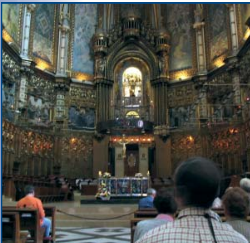
Domkirken La Seu, Barcelona.

Forside: Kirken »La Sagrada Familia«, Barcelona.